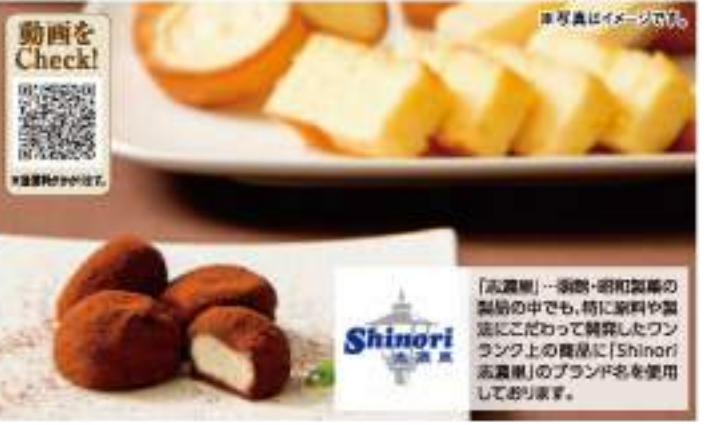
高級スイーツの会認定商品の生ショコラミルクが入ったギフトです。なめらかなチョコレートにたっぷり生クリームを使用し、一粒一粒丁寧に仕上げました。

●内容 たまごろうくんの焼きドーナツ(プレーン/ベリー/ベリー/かぼち/チョコ/くるみ/抹茶/各2個) ●賞味期限 常温30日 ●B102