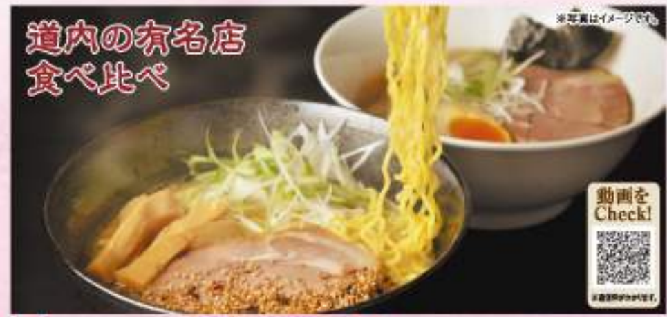
道内の有名店 食べ比べ