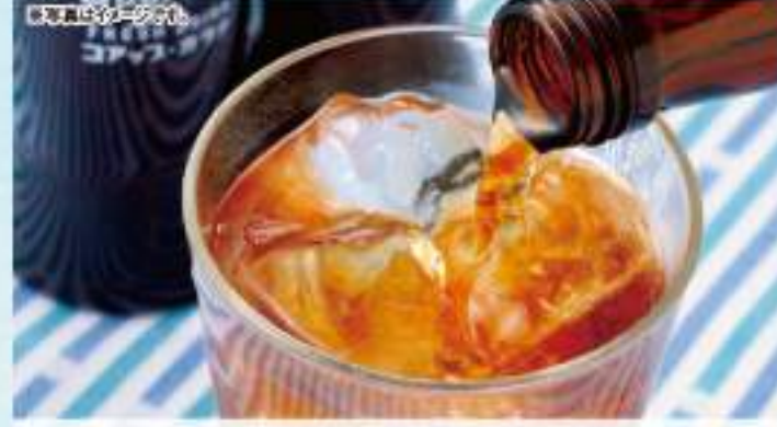
北海道横津岳の天然水を使用した、「北海道限定」の人気炭酸飲料です。