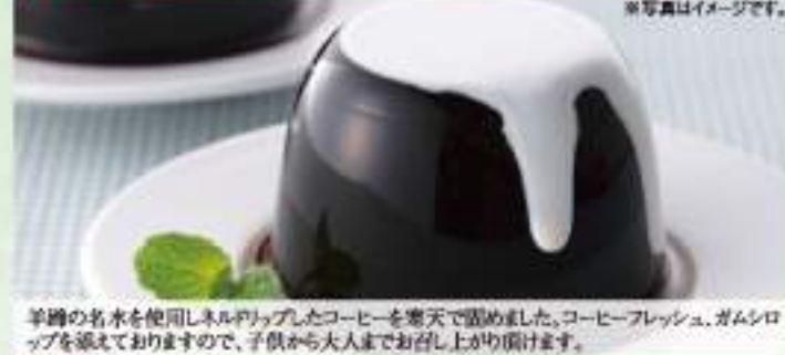
羊蹄の名水を使用しネルドリップしたコーヒーを常温で固めました。コーヒーフレッシュ、ガムシロップを添えてありますので、子供から大人までお召上がり頂けます。