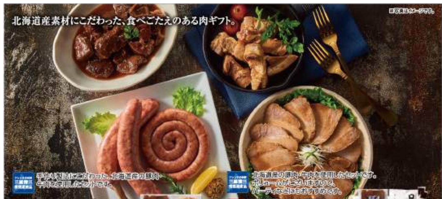
北海道産素材にこだわった、食べごたえのある肉ギフト。