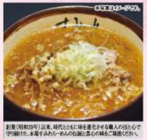
創業(昭和19年)以来、時代とともに味を進化させる職人の技と心で守り続けた、本号すみれラーメンの伝統と真心の味をご堪能ください。