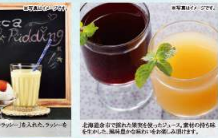
北海道産素材を使用したジュースに、夏にぴったり4フレーバーのジンジャーエールを詰め合わせました。