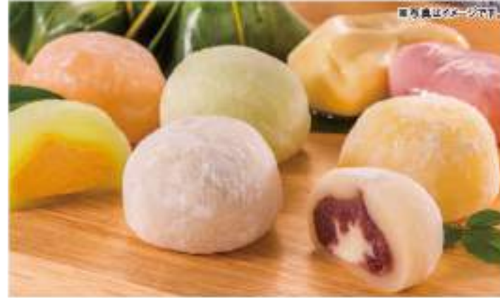
生熟狗特有のもちもち粘り感とふわふわな大福の詰め合わせセットです。

●内容 海苔塩ポテト/200g×3、あずまポテト/七色/りんご/各200g ●賞味期限 冷蔵14日 ●B102