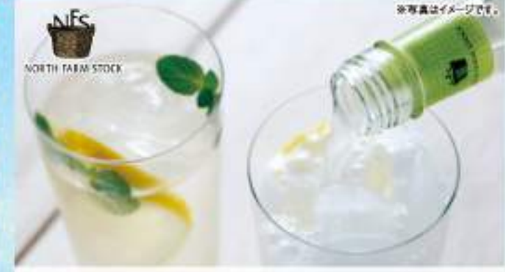
北海道産素材を使用したジュースに、夏にぴったり4フレーバーのジンジャーエールを詰め合わせました。