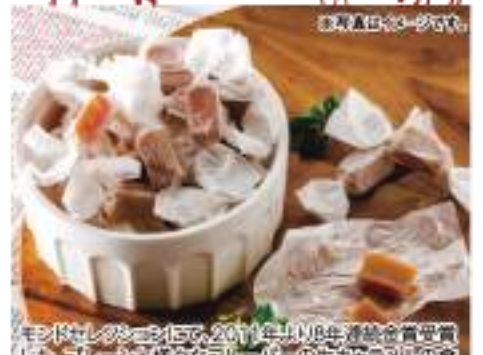
モントセリタージュに、2011年、18年連続受賞した、プレーンと様々なフレーバーの生キャラメルを比べセットです。

●内容 あずま粘り頭/35g×2、はず粘り頭/35g×2、ふわふわ大福北海道メロン/ふわふわ大福小豆クリーム/ふわふわ大福カスタード/ふわふわ大福生キャラメル/各50g×2 ●賞味期限 冷蔵50日 ●B102