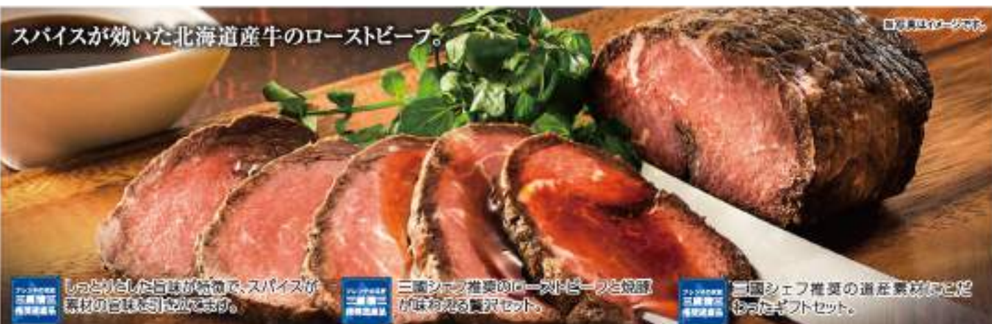
スパイスが効いた北海道産牛のローストビーフ。