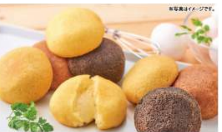
ふわふわのスポンジにはコクのある「オリジナルクリーム」がたっぷり!一度食べたらやめられない!!

●内容 生キャラメルドライブレッド/70g×2、生キャラメルプレーン/70g×2、生キャラメルチョコレート/70g×2、生キャラメル北海道産いちご/70g×2、生キャラメル北海道産メロン/70g×2、もちもち生キャラメル/110g、とやまとう生キャラメル/100g ●B102