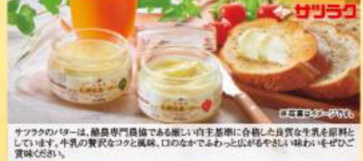
サクサクのバターは、酪農専門農協である厳しい自主基準に合格した良質な生乳を原料としています。牛乳の豊かなコクと風味、口のなかでふわりと広がるやさしい味わいをぜひご賞味ください。