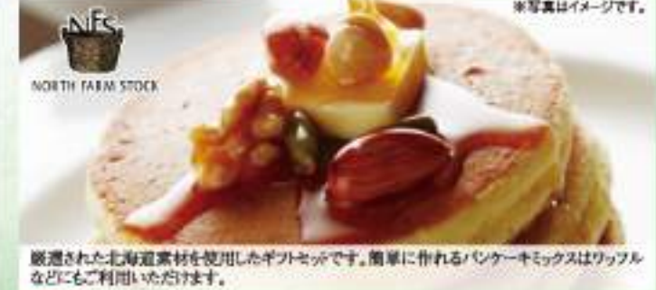
厳選された北海道産素材を使用したギフトセットです。簡単に作れるパンケーキミックスはワッフルなどにもご利用いただけます。