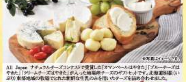
All Japan ナチュラルチーズコンテストで受賞した「キャンベルはやきた」「ブルーチーズはやきた」「クリームチーズはやきた」が入った地産地消チーズのギフトセットです。北海道(厚岸(いぶり) 東部地域)の牧場でとれた新鮮な生乳のみを用いたチーズを詰め合わせました。