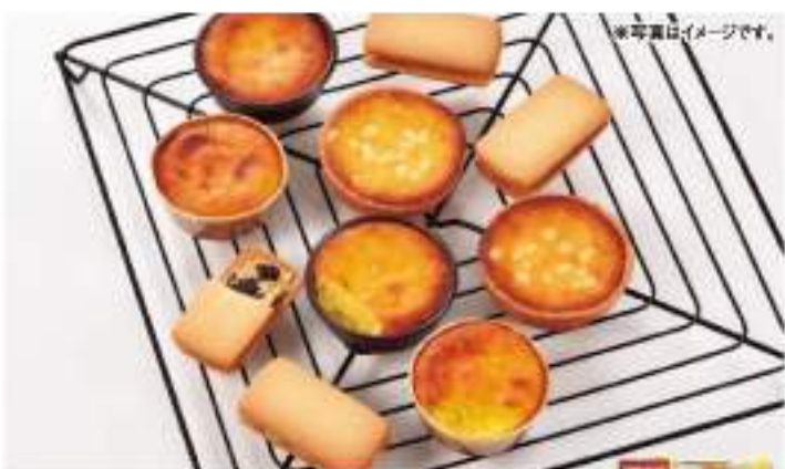
北海道産の甘くて濃厚な味わいのおいも「インカのめざめ」を使用したスイーツと、わかざや本舗のロングセラー商品「バターリッチ」を合わせました。

●内容 自家製バタークッキー/純生カマンベールチーズクッキー/2枚×各4枚、生チョコクッキー/4枚、朝顔ハイカブレットクッキー/生チョコホワイトチョコ/各4枚、北海道チョコ/50g ●賞味期限 常温50日 ●B102