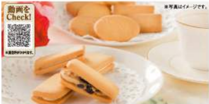
北海道の素材を生かしたクッキーの詰め合わせです。