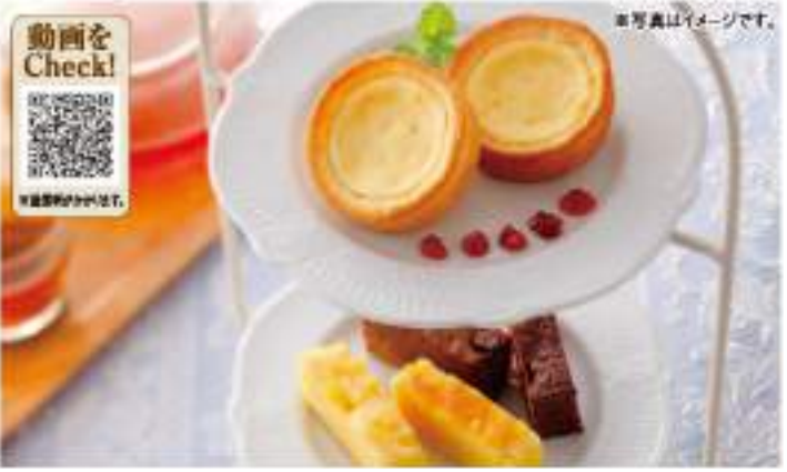
北海道産カマンベールをたっぷり使用し、じっくり焼き上げた逸品。

●内容 チーズタルト/4個、生ショコラミルク/5個、チーズスティック/4本、カマンベールチーズケーキ/2個(各50g) ●賞味期限 冷蔵70日 ●B102