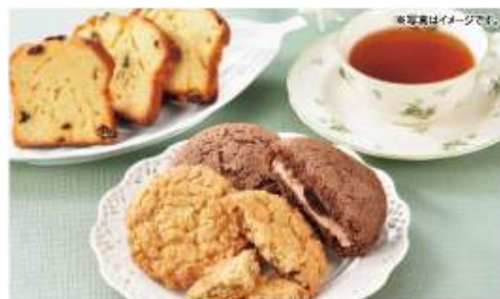
レーズン入りのパウンドケーキ「ニースからの贈り物」、くるみがごろごろ入った「くるみ割リクッキー」、濃厚なチョコレートの味わいが楽しめる「チョコランド」をおしゃれな箱に詰め合わせました。

●内容 じゃがバター/スイーツポアッターズ/とびと/各2箱、バターリッチ/じゃがバター/タルト/各4箱 ●賞味期限 常温45日 ●B102