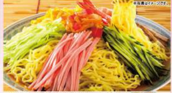
北海道産の秋エキスを使用した清涼感のあるスープです。麺はたっぷり140gで満足品来る冷し中華です。