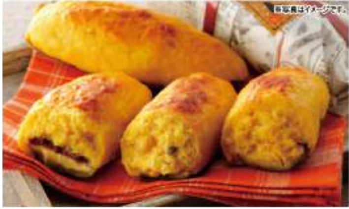
さつまいも(紅あずま)に、北海道産の乳製品、グラニュー糖、じゃがいもを加えてこだわったスイーツポテトです。

●内容 ニースからの贈り物/ワインレーズン/1箱、チョコランド/くるみ割リクッキー/各2箱 ●賞味期限 常温35日 ●B102