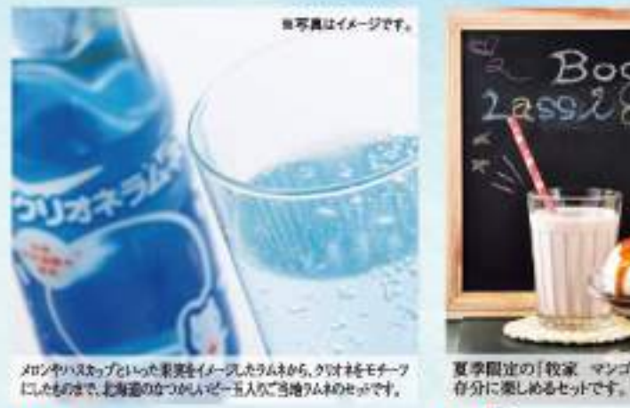
メロンやハスカップといった果実をイメージしたラムネから、クオネをモチーフにしたもので、北海道のなつみん(五入)ご当地ラムネのギフトです。