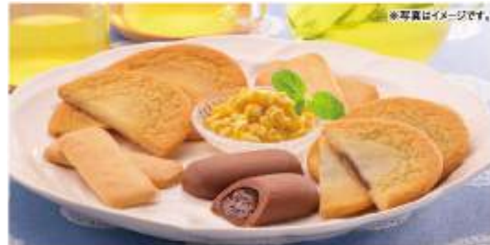
北海道産とうもろこしにホワイトチョコを混ぜさせた新感覚のチョコ「北海道チョコ」と、北海道産の原料を使用したクッキーの詰め合わせです。

●内容 北海道産ミルククリームサンド/6枚、じゃがバタークッキー/10枚、夕張メロンクリームサンド/北海道産バター/リッチポアッターズ/バター/サブ/各5枚 ●賞味期限 常温50日 ●B102