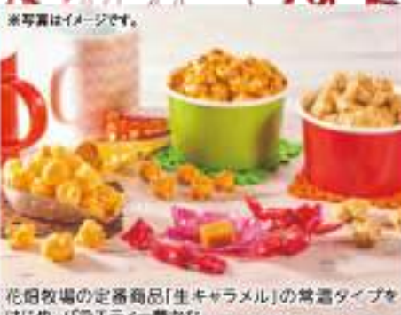
花畑牧場の定番商品「生キャラメル」の常連タイプをはじめ、パウエティー豊かなお菓子をご提案しました。

●内容 十勝産ラブレッド/70g×2、十勝ゴールデンオーガ/70g、十勝のチノのブレッド/80g、ポークジャーキー/20g×2 ●B102 ●一部「ジャーキー」が賞味期限になる場合がございます。