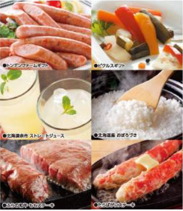
● トンダシファームギフト ● ビグルスギフト ● 北海道余市 ストレートジュース ● 北海道産 おぼろぶき ● さらさらの中華 中華スープ ● たらばがにステーキ

● 期間限定の商品がございます。 ● 掲載の調理写真で使用している食品・食器等は商品に含まれておりません。 ● 包装は季節包装のみとなります。 ● 冷凍・冷蔵商品はクール便でお届けいたします。(一部冷蔵品等、宅配できない地域がございます。) ● ギフトセットの詰め合せ内容を一部変更させていただく場合がございますので、予めご了承ください。 ● 季節・天候により一部商品が異なる場合がございます。 ● 各コースには、お申し込みハガキなど、かかる料金が全て商品代に含まれています。