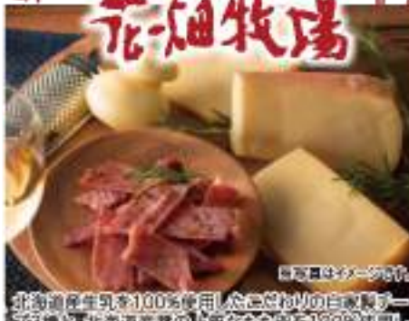
北海道産生乳を100%使用したこだわりの自家製プレーンと、北海道産素材の上品なもも肉を100%使用した独自製法のジャーキーです。

●内容 生キャラメルプレーン/生キャラメルチョコレート/生キャラメル北海道産いちご/生キャラメル北海道産メロン/各8枚タイプ ●賞味期限 冷蔵50日 ●B102