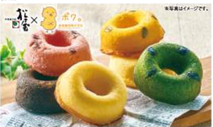
鉄道のたまごやさん「道東産」のキャラクター「たまごろうくん」とコラボした焼きドーナツです。甘さ控えめのしっとり食感で、卵のコクがたっぷり感じられます。

●内容 牛の卵(プレーン/生牛乳/生卵/生牛乳/生卵/生牛乳/生卵/各3個 ●賞味期限 冷蔵60日 ●B102