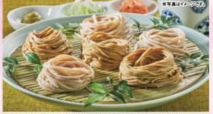
高良野産そばの実を使用した牡丹蕎麦や船越(だつたん)蕎麦、北竜町のそば屋が育てたそば粉を使用した北早生(きたわせ)蕎麦など北海道産原料にこだわった生蕎麦のセットです。